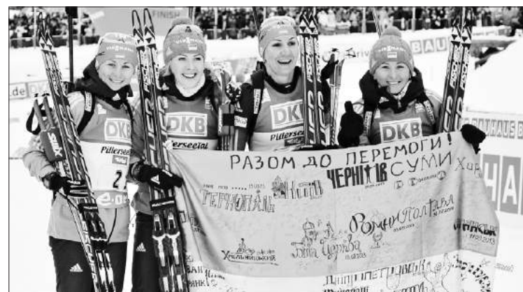
Сторінку підготував Владислав Дем'яненко.

Результати естафети 4x6 км. 1. Італія – 1: 05.32,6 (0 + 8) 2. Німеччина – відставання 0,2 (0 + 7) 3. Україна (Юлія Джима, Ольга Абрамова, Валентина Семеренко, Олена Підгрушна) – + 13,1 (0 + 10).